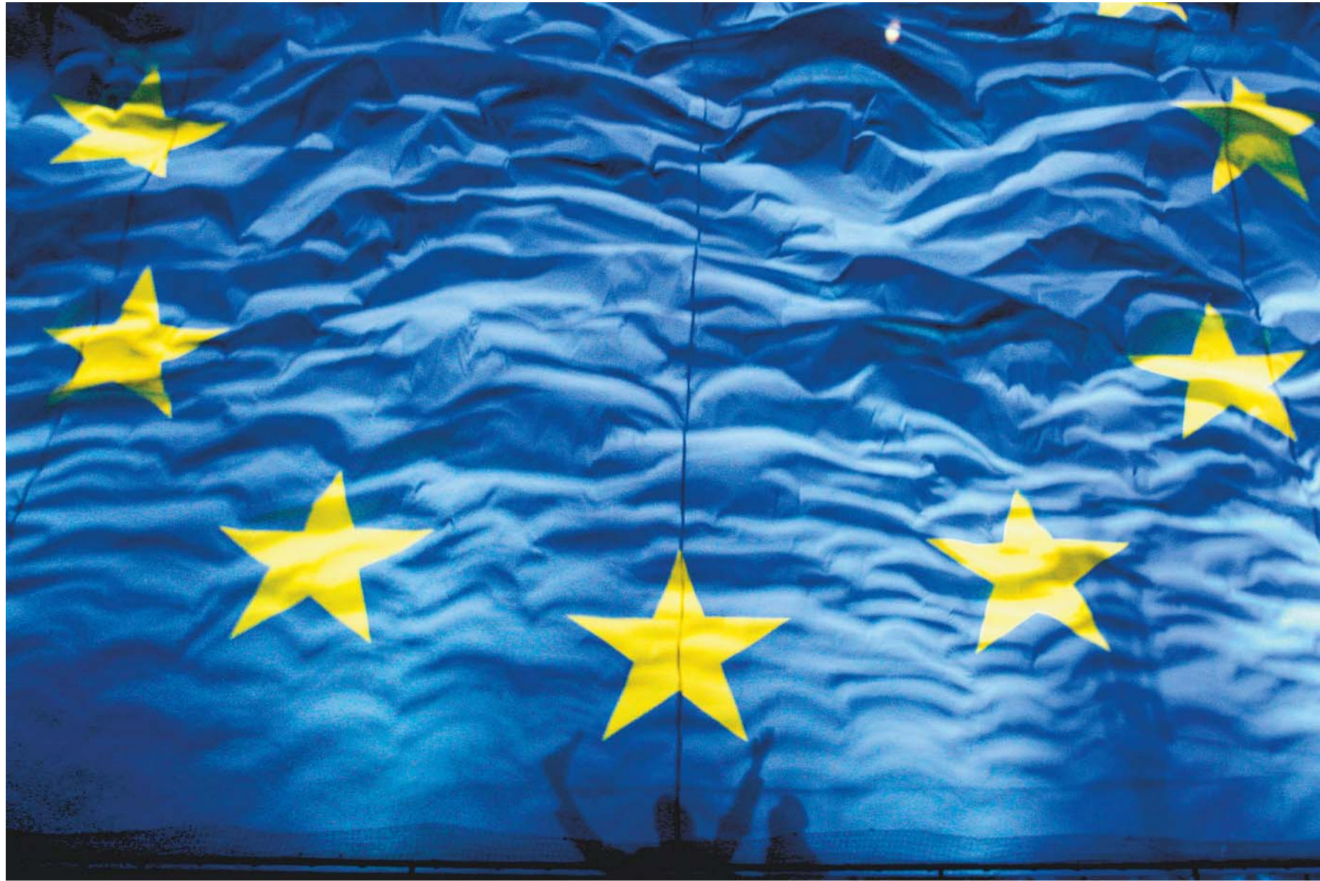
Die letzten Erweiterungen der Union bedeuten eine Bereicherung Europas – und bieten die Chance zur ordnungspolitischen Besinnung auf das Wesentliche.

Erhard und Hayek – das sind zwei Liberale mit gleichen Vorstellungen über das Wünschenswerte und doch hochgradig verschiedenen Erwartungen über das Wahrscheinliche. Wie konnte Hayek in dunkelsten Zeiten eine so ordnungspolitisch optimistische Vision föderativer Zusammenschlüsse entwickeln, während Erhard in Friedens- und Wirtschaftswunderzeiten